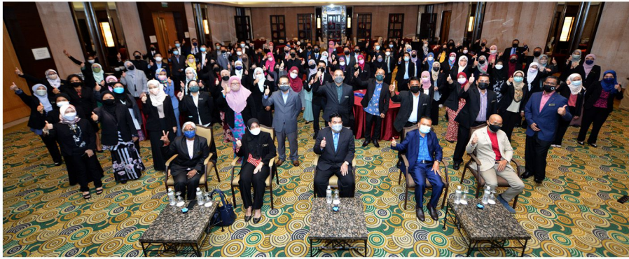
Majlis Perasmian Persidangan Bahagian Guaman Tahun 2021 The Saujana Hotel, Shah Alam, Selangor 10-12 November 2021