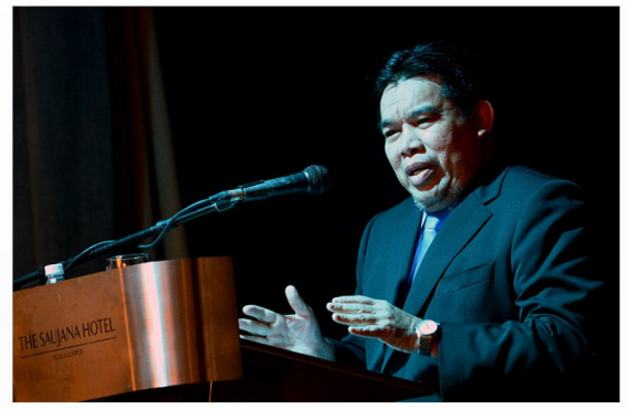
Majlis Perasmian Mesyuarat Agung Tahunan (AGM) JALSOA Sesi 2019/2020 dan Sesi 2020/2021 Jabatan Peguam Negara 19 November 2021